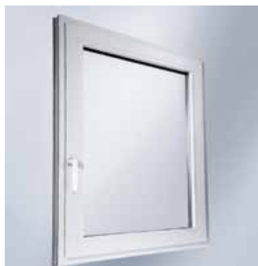
Schüco AvanTec Beschlag Funktionalität, die man nicht sieht

Mit Öffnungswinkeln von 90° ist Schüco AvanTec in allen gängigen Fenstergrößen und Öffnungsarten erhältlich. Bis zu 160 kg Flügelgewicht bewältigt das System. So lassen sich auch große Fenster sicher und komfortabel öffnen und schließen.