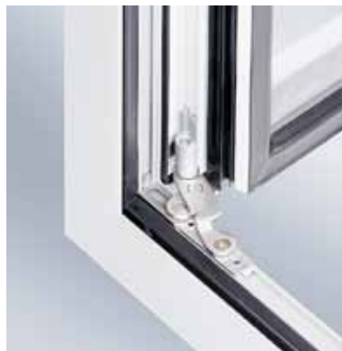
Schüco AvanTec Ecklager