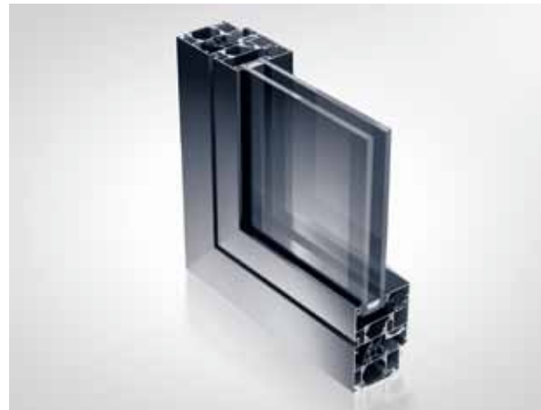
HomeLine (System Schüco AWS 65) Kompakt und praktisch

BE Aluminiumfenster HomeLine sind Allrounder. Nicht sichtbare Beschläge und gute Wärmedämmwerte gehören zur Basisausstattung. HomeLine-Fenster überzeugen insbesondere mit ihrem erstaunlichen Preis-Leistungs-Verhältnis die Bauherren, die weder auf Qualität noch auf Design verzichten wollen. Das umfangreiche Profilsortiment ermöglicht vielfältige Anwendungen.