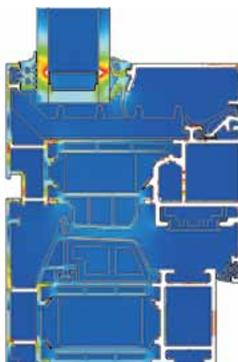
SelectLine Innovative Technik sorgt für optimale Wärmedämmung

Der sorgsame Umgang mit Energie ist in BE Aluminiumfenster schon eingebaut. Innovative Schaumverbundisolerstege, großvolumige Mitteldichtungen und umlaufende Verglasungsdichtungen der Schüco-Aluminiumsysteme bescheren den Fenstern beste Noten in Sachen Wärmedämmung. Die hervorragenden Dämmeigenschaften stellen auch Bauherren mit höchsten Ansprüchen zufrieden. Da darf die Fensterfläche dann gern schon mal größer ausfallen – für mehr Licht und weniger Wärmeverlust.