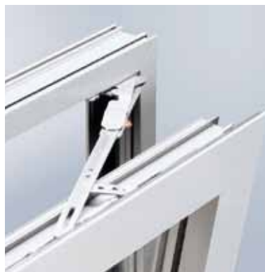
Schüco AvanTec Scherenlager