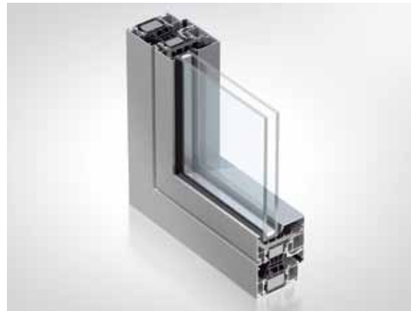
SelectLine (System Schüco AWS 75.SI) Anspruchsvoll und elegant

Die BE Aluminiumfenster SelectLine erfüllen höchste Ansprüche der Bauherren, die moderne Technik, bedienungsfreundlichen Komfort und elegante Ästhetik erwarten. Neu- und Altbauten verleiht SelectLine einen repräsentativen Charakter. Vielfältige Einsatzbereiche erfüllen nahezu alle Anwenderwünsche. Auf höchstem technischen Niveau und ausgestattet mit einem hervorragenden, zukunftsorientierten Wärmedämmsystem verfügt SelectLine über erstklassige Merkmale.