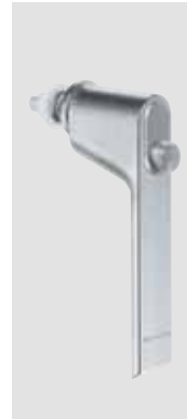
WK-Fenstergriff mit Sperrtaste